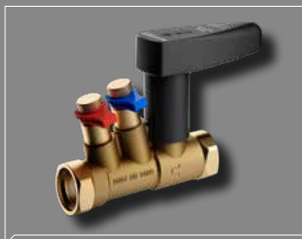
3 i 1: Reguleringsventil + afspæringsventil + flowmåling

Forindstilling, måling og afspæring ved hjælp af variabel blænde, en alt-i-en-løsning