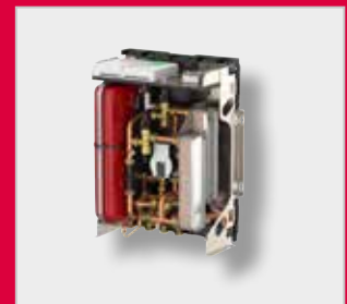
LogoEco Dual G2 Fűtési interfész egység