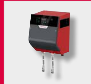
FlexFiller Mini Јединица за одржавање