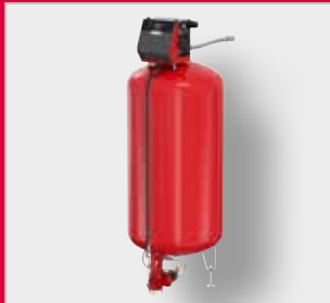
Flamcomat G4 MK-C Експанзиони аутомат