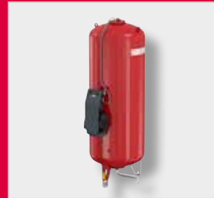
Flexcon MK-U Експанзиони аутомат *