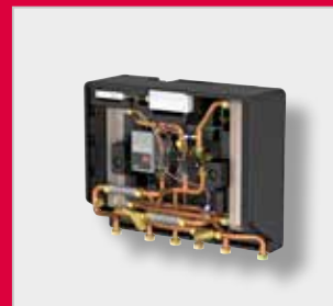
LogoEco G2 Топлотне интерфејс јединице