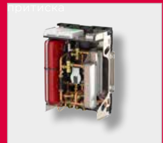
LogoEco Dual G2 Топлотне интерфејс јединице