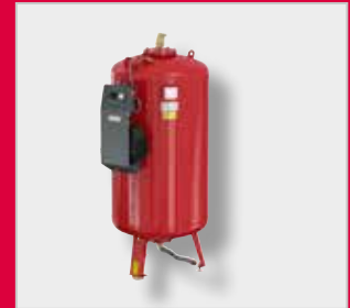
Flamcomat MK-U G4 Експанзиони аутомат