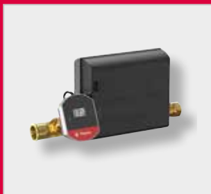
Flexcon PA Асистент за одржавање притиска