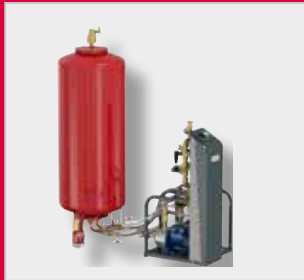
Flamcomat G3 Експанзиони аутомат *