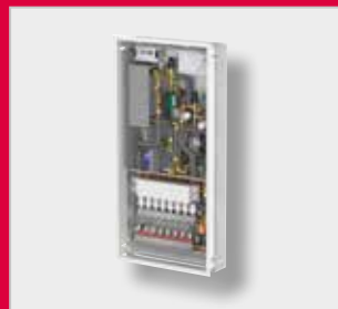
LogoMatic G2 Топлотне интерфејс јединице