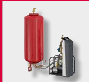
Flamcomat MP G4 Експанзиони аутомат