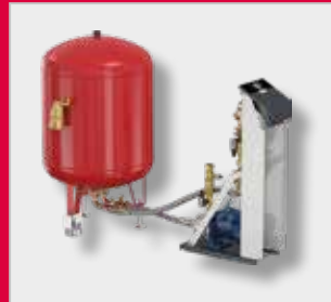
Flamcomat G4 Starter Експанзиони аутомат