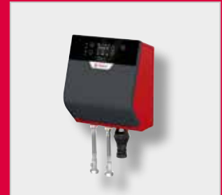
FlexFiller Direct G4 јединица за одржавање