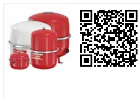
Flexcon Premium expansievaten

SideFlow Clean Alles-in-één deelstroomfilter voor verwarmings- en koelingssystemen