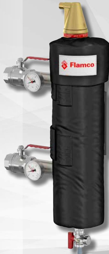
SideFlow Clean 5,0 L