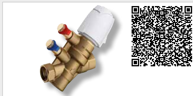
NexusValve Vivax PICV (Dynamisch strangregelventiel)