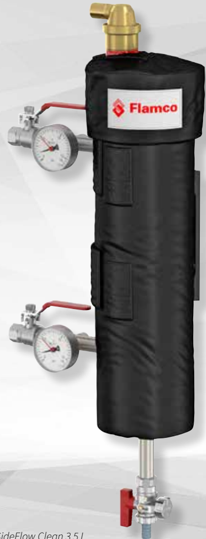
SideFlow Clean 3,5 L