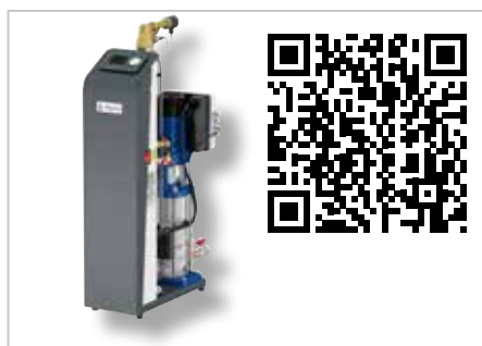
Vacumat Eco Vacuüm ontgasser