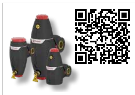
XStream lucht- en vuilafscidders

Flamco biedt een uitgebreid assortiment producten van 'bron tot afgiftepunt. Hieronder de uiterst innovatieve Flamco XStream lucht- en vuilafscidders, de Vacumat Eco vacuüm ontgassers en de Flexcon Premium expansievaten.