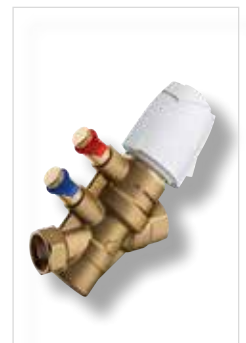
NexusValve Vivax PICV (dynamisch strangregelventiel) (separaat te bestellen)