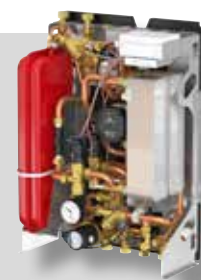
LogoEco G2 Dual