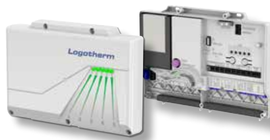
Rys.2 : LogoTronic Hub OTC

LogoTronic jest dostarczany z czujnikiem temperatury zewnętrznej. Ten czujnik implementuje wartość temperatury zewnętrznej do sterownika LogoTronic, który rozsyła dalej te dane przez Modbus RTU do różnych zainstalowanych jednostek Logotherm®.